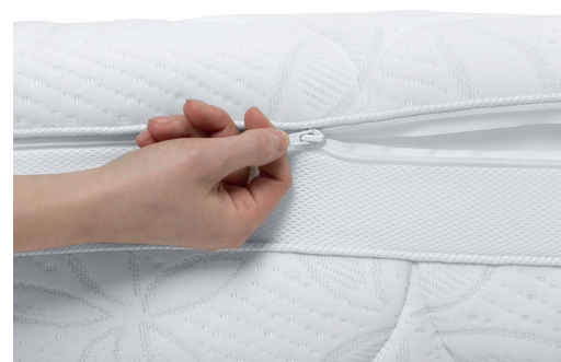
Fot. 5. Pielęgnacja materaca i pokrowca.