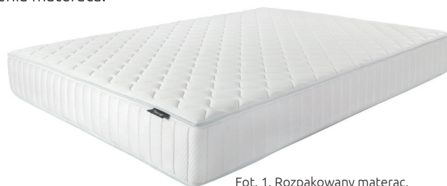
Fot. 1. Rozpakowany materac.