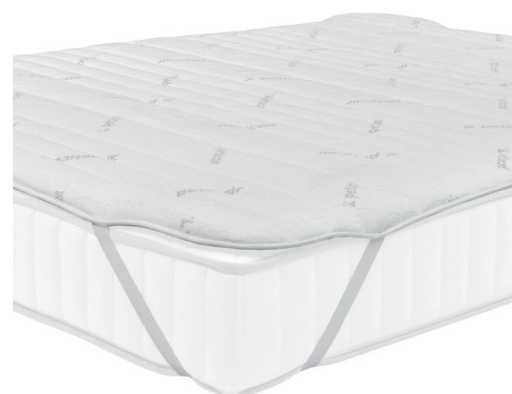
Fot. 6. Nakładka ochronna na materac.