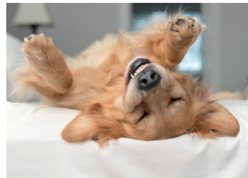
Fot. 4. Ochrona materaca przez uszkodzeniami.